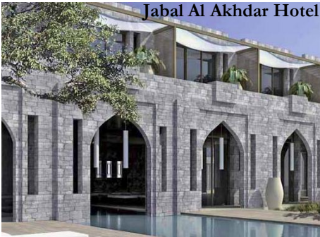
Jabal Al Akhdar Hotel

Le 5* Sheraton Muscat rouvrira quant à lui l'année prochaine, après plusieurs années de rénovation. Paré d'un nouveau décor somptueux, l'établissement comptera 230 chambres.