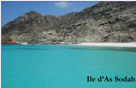
Ile d'As Sodah

A Mascate, 5 hôtels, de catégorie milieu et haut-de-gamme vont voir le jour d'ici 2012, pour répondre au mieux à la demande sur ces segments : un 2*, le SwissBel et ses 90 chambres, un 3*, le Tulip Inn (Al Khuwair), doté de 153 chambres, et trois établissements 4* : le City Seasons Hotel , (269 chambres), le Best Western (200 chambres) et le Holiday Inn Seeb (176 chambres).