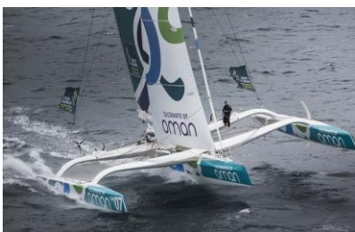
Trimaran MOD70 « Musandam-Oman Sail »