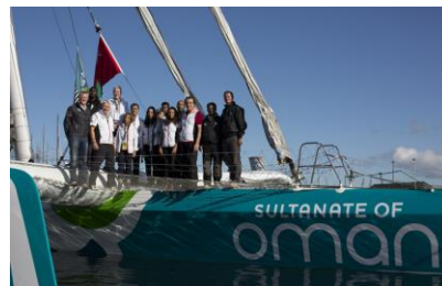
Trimaran MOD70 « Musandam-Oman Sail »