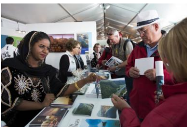
Stand Oman